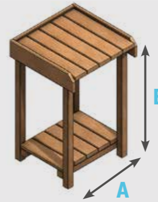
SUPPORT PLANCHA | Dimensions standards